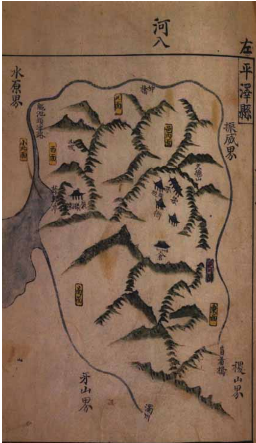
〈지도 2〉 『여지도』중 평택현(平澤縣), 18세기 전반(서울대학교 규장각 소장)