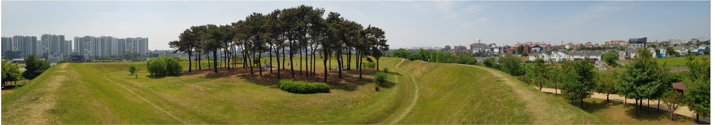
〈사진 1〉 평택 능성 성내부 전경